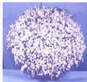
世界らん展日本大賞2011大賞花