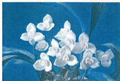
世界らん展日本大賞2009大賞花