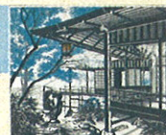
「華堂初夏」1998年(白台会派出品)